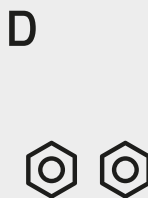
2 Porcas M8